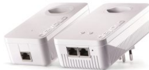
dLAN 1200+ WiFi ac: Mit integrierter Steckdose und Ethernet-Anschluss.

D as neue dLAN 1200+ WiFi ac von Devolo kann in ein bestehendes WLAN integriert werden, es lässt sich damit aber auch ein eigenes Netz aufspannen. So kann der Nutzer an jeder Steckdose seines Hauses einen WLAN-Hotspot errichten.